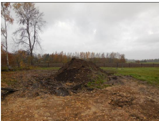
Foto B1.3 Grondhoop aan de westkant van de locatie