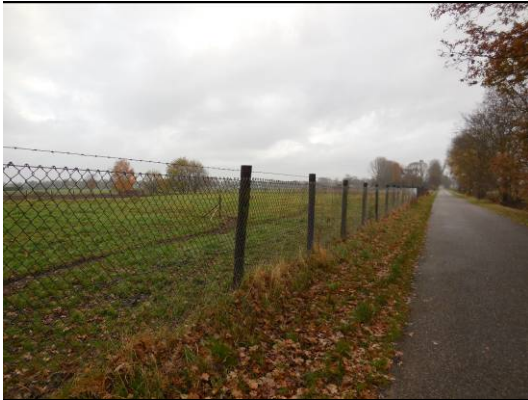
Foto B1.1 Raster langs de Groeneveltweg. Het raster staat rond de hele locatie