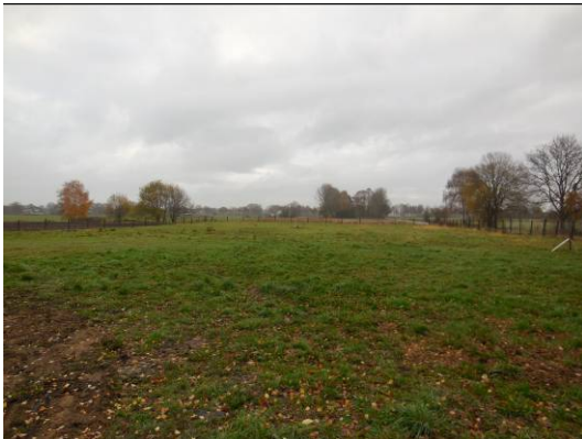
Foto B1.2 Globaal overzicht over de paardenwei