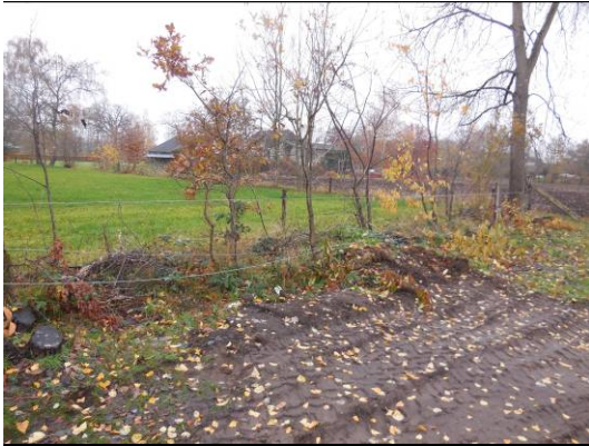
Foto B1.4 Begroeiing aan de westkant van de locatie bestaande uit kleine en enkele grote bomen