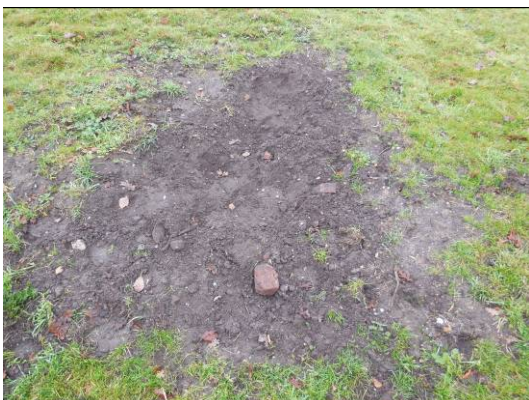
Foto B1.6 De afdeklaag is op enkele plekken opengetrapt of gelopen door een paard en in de afdeklaag is puin (steen) zichtbaar