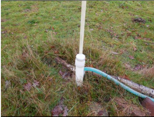
Foto B1.7 Peilbuis A1 in het midden van de locatie