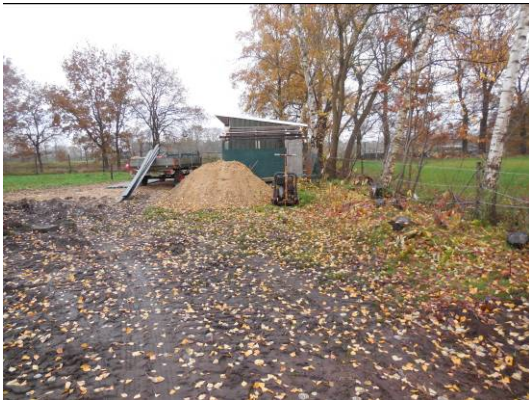
Foto B1.5 Schuur (onderkomen voor het paard) en een zandhoop aan de westkant van de locatie